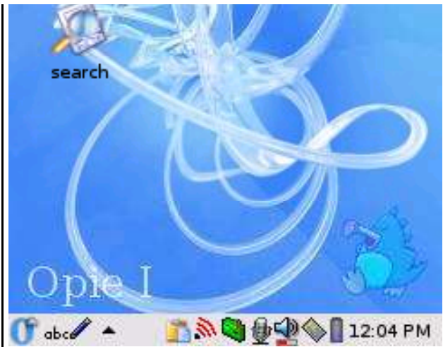
Il desktop di Opie 1.0